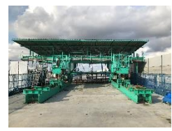
作業移動車(ワーゲン)

右岸側から開通を目指し、早期工事を進めている。平成30年10月から左岸側（南側）、令和元年10月から右岸側（北側）の上部工に着手しており、早期開通を目指し、早期工事を進めている。