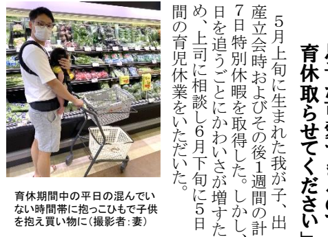
育児期間中の平日の混んでいない時間帯に抱っこひもで子供を抱え買い物に