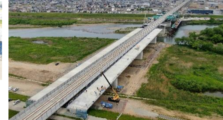
工事中の状況(左岸側から)