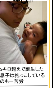
5キロ越えて誕生した息子は抱っこしているのも一苦労

5月上旬に生まれた我が子、出産立会時およびその後1週間の計7日特別休暇を取得した。しかし、日を追うごとにかわいさが増すため、上司に相談し6月下旬に5日間の育児休業をいただいた。書類の提出だけで容易に取得できた。育児期間の1カ月程度前に申請が必要であった。その期間中に自分の担当業務の引き継ぎや、ほかの方に迷惑が掛からないように、仕事を済ませることができた。