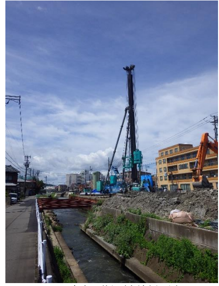
工事中の状況(上流側から)

底喰川は福井市市街地を東西に貫流する典型的な内水河川で、近年周辺部の開発が急速に進み、それに伴う保水・遊水機能の減少によって、たびたび浸水被害が生じている。このため、昭和54年より治水安全度50分の1（50年に一度程度の確率で発生する洪水規模）を確保するための河川改修工事を推進している。全体改修区間5,880mのうち日野川合流部より3,500mについては、日野川の改修をにらみ暫定断面（10分の1）にて改修を進め、現在完了している。今後は事業の進捗を促すため計画規模10分の1の断面にて整備を進める。明道橋より上流区間については、橋梁が連続するため、計画規模50分の1での整備を進める。