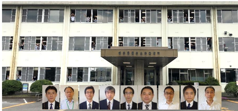
コロナ禍にあっても職員は元気いっぱいです！

緊急事態宣言が発令され、県庁全体でコロナの感染拡大防止業務に取り組んだ。福井土木でも寄付された医療資材の病院等への配送、マスクあつせん事業、病院での検温業務、保健所での電話対応など所員が総動員で業務に当たった。