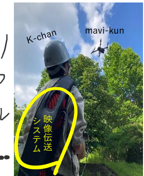
危機対策防災課より R2.6.16 導入