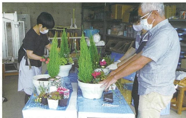
推進員による寄植えの実習