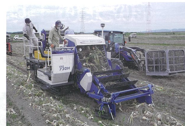
すえまさファーム タマネギ収穫の様子

今後の展開 永平寺町はJAとともに「永平寺町タマネギ協議会」を立ち上げ、タマネギを町の特産野菜として推進しています。そのため、集落組織におけるタマネギ栽培の取組みモデル経営体となり、地域への普及を図りたいと考えています。