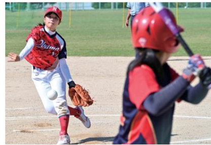
地域展開により新たな地域クラブ活動で 大会出場