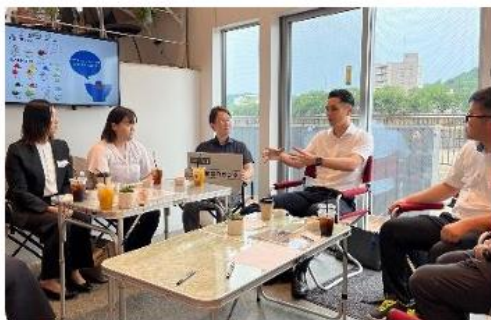
ふくい教育ミライ会議