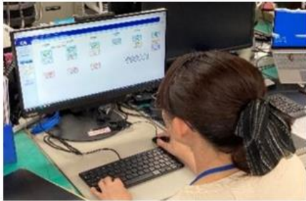
校務支援システム活用の様子