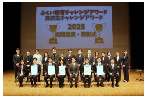
ふくい教育チャレンジアワード