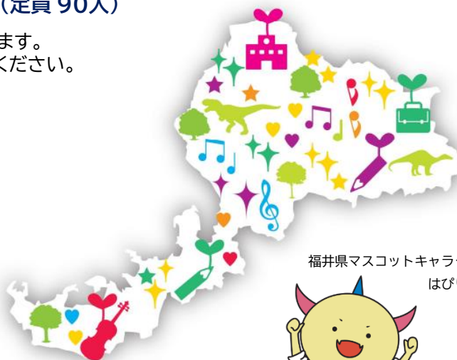
福井県マスコットキャラクター はぴりゅう