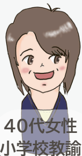
40代女性 小学校教諭

福井の先生方は、温かく、しかも向上心が高いと思います。子どものよりよい学びのために自主的に研究し、そして共有する風土が整っています。先生一人一人の個性ややる気を尊重しながら、よりよい解決に向かって知恵を出し合い、ともに働いています。