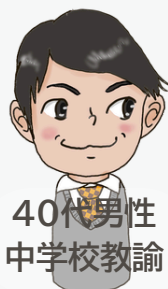
40代男性 中学校教諭

教えて先生！ふくい教育、ふくいの公立学校って…？ 実際に福井で働く先生にインタビューしてみました！