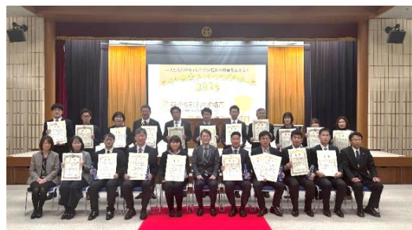
ふくい教育チャレンジアワード