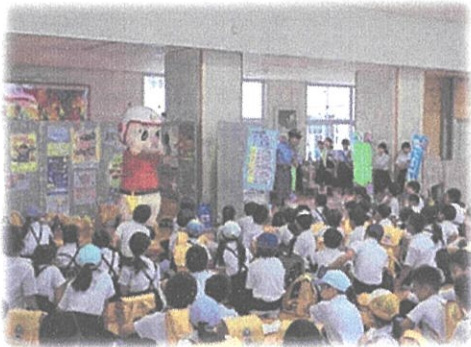
(小学校での防犯教室)