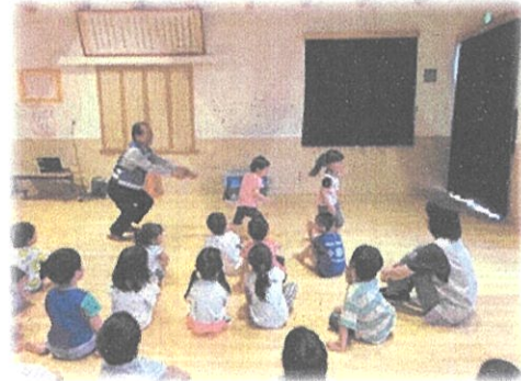
(保育園での防犯教室)