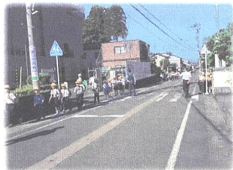
(集団登校中の警戒)