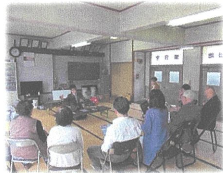
（夕方見守り運動への参加依頼）