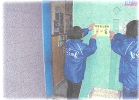
（立寄所ステッカーの掲示）