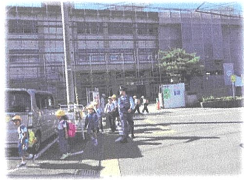
(集合場所周辺の警戒)