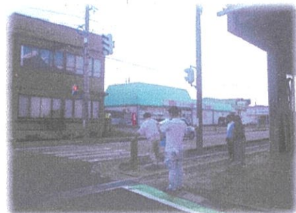
(安全点検の実施状況)