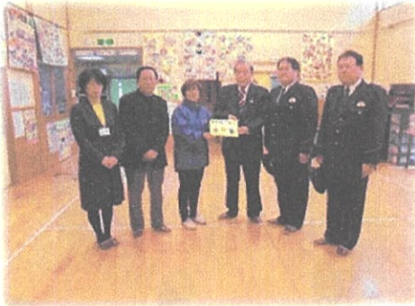
（立寄所ステッカーの贈呈）