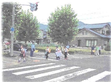
(横断歩道での交通監視)