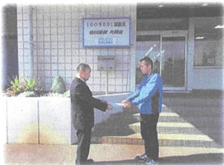
（宅配業者への協力依頼）