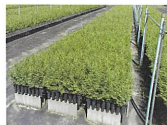
苗木供給体制の整備 (コンテナ苗)