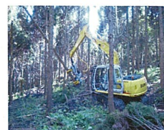
高性能林業機械の導入 (ハーベスタ)