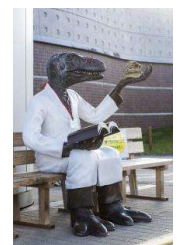
恐竜ベンチ (イメージ)