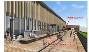
観光交流センター (設置イメージ)