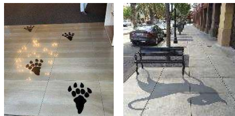
恐竜足跡・影ペイント (イメージ)