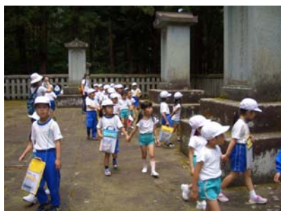
大安寺に親しもう（幼小交流）