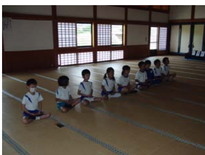
大安寺お宝見つけ隊