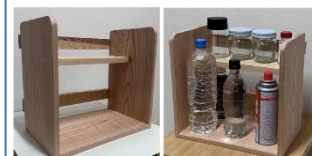
※写真は作成イメージです