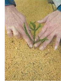
▲挿し床による挿し木 (従来方法)