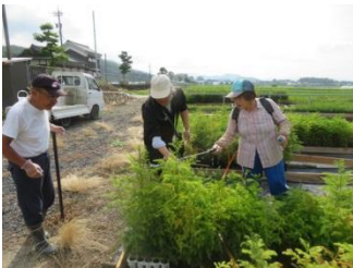
▲苗木生産者による雄花着花促進のためのジベレリン処理