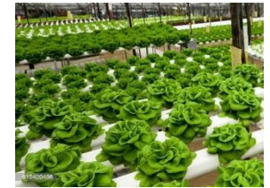
▲農業分野で利用されている水耕栽培 (イメージ写真)