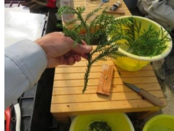
▲採穂した穂木 (県産無花粉スギ)