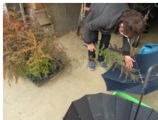
▲苗木生産者による県産無花粉スギの検定状況