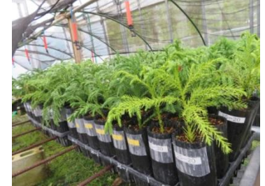
▲県産無花粉スギクローン苗