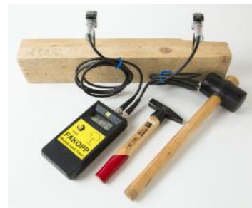
写真 応力波速度測定器 (FAKOPP)