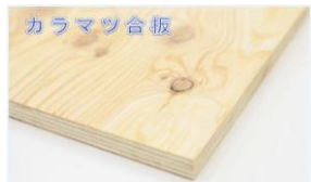
写真 カラマツ合板