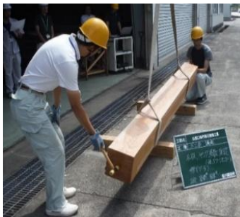
写真 固有振動数計測

・丸太の応力波伝播速度と固有振動数による縦振動ヤング係数から強度分布を調査し、材質を把握