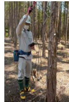
写真 応力波伝播速度計測