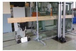
写真3 実大強度試験機