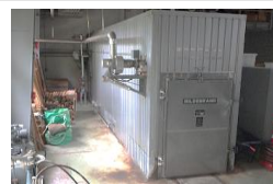
写真2 蒸煮処理用人工乾燥機