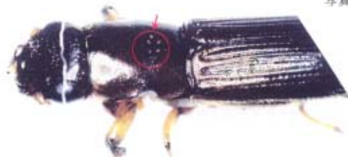
写真2: カシノナガクイムシ(雌)の背中の孢子貯蔵器官