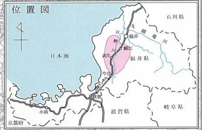
図1 日野川地区水道用水供給事業 採水地点