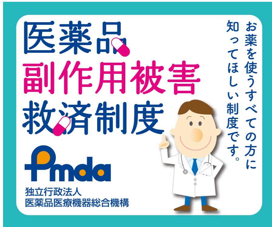
①レクタングル (大) / 左右 336pix × 天地 280pix