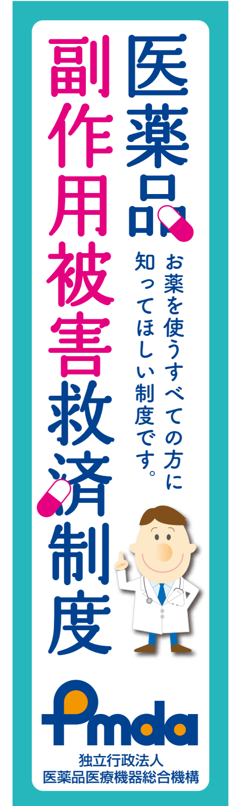
④ワイドスカイスクレイパー / 左右 160pix × 天地 600pix