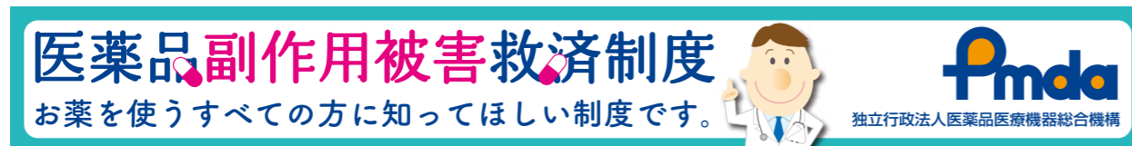
②バナー / 左右 468pix × 天地 60pix