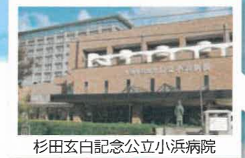
杉田玄白記念公立小浜病院