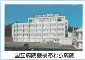
国立病院機構あわら病院