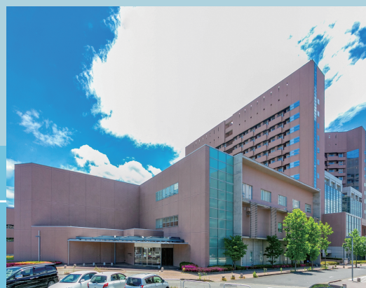
福井県立病院 陽子線がん治療センター