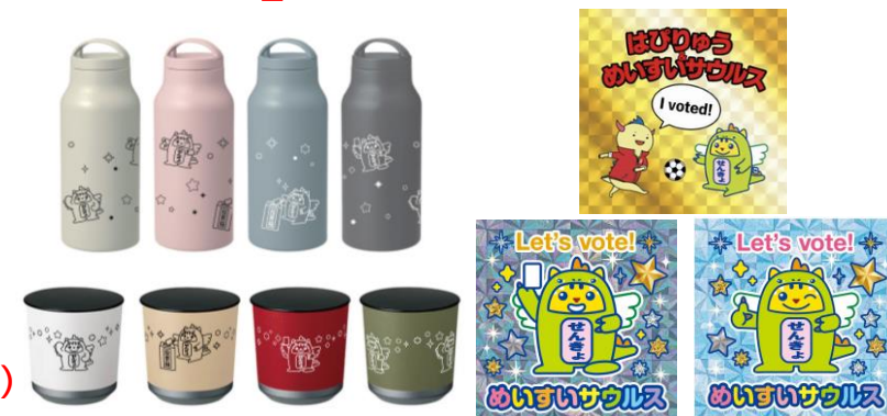
オリジナルグッズ