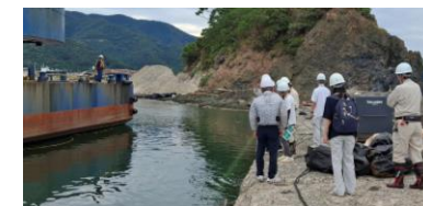
部内横断研修 取組状況