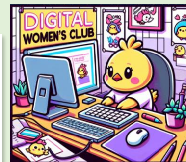
ロゴマーク(生成AIで作成)