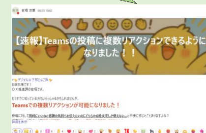
PCの小技を共有する「ひよこDiary」