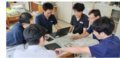
臨時会議(個別対応)