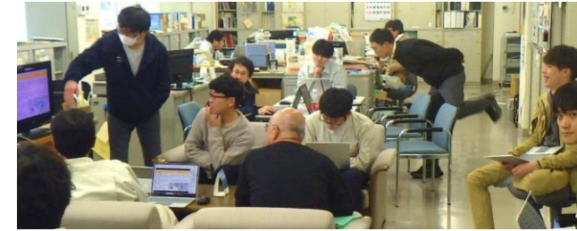
定期会議(全員参加)