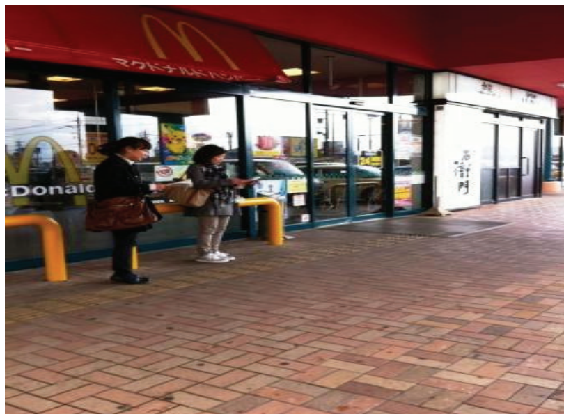
ワイプラザ(新保店)