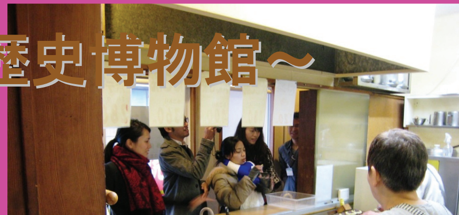
まち歩き： お好み焼き屋