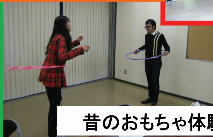
昔のおもちゃ体験