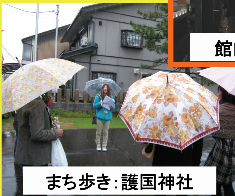
まち歩き：護国神社