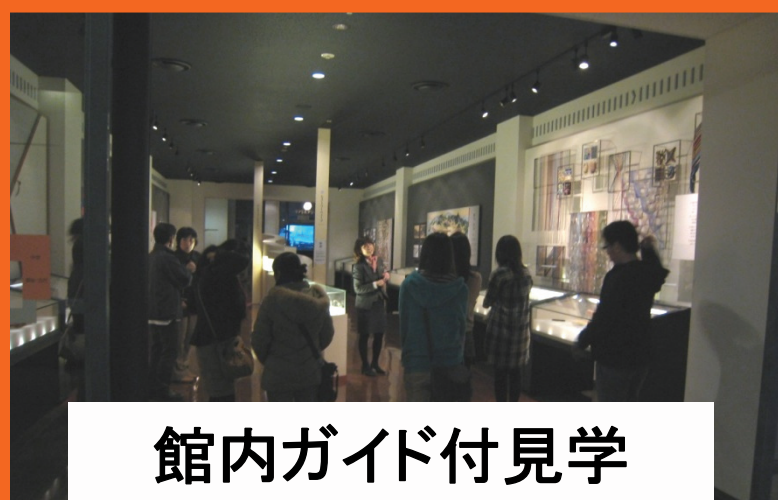
館内ガイド付見学