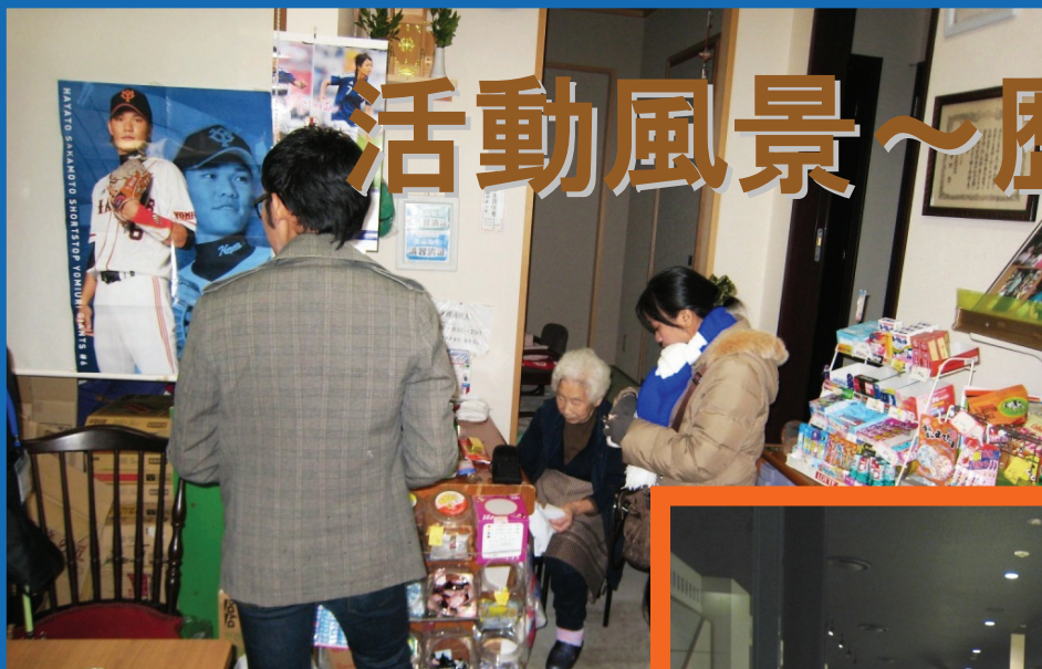
まち歩き：駄菓子屋