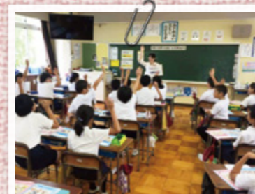
調査や意見交換の中で、家族が協力する大切さを学習

県内の小学5年生を対象に、県職員が学校に出向き、家庭の仕事の分担に関する授業を実施しています。