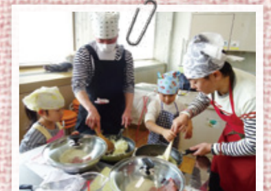
男性対象の実技講座には、家族ぐるみでの参加者も

家事の基礎的な知識を、クイズ形式で確かめることができ、インターネットなどでも気軽に挑戦できます。