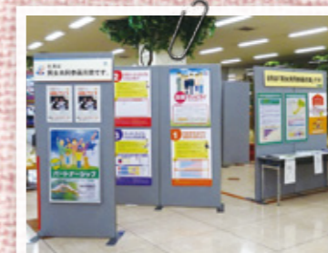
幅広い年代に考えてもらおうと、パネル展などで啓発

地区の集会等で男女共同参画について考える場を持ってもらい、地域に女性の力を生かしていただくきっかけづくりをしています。