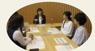
(ロールモデル交流実践講座)