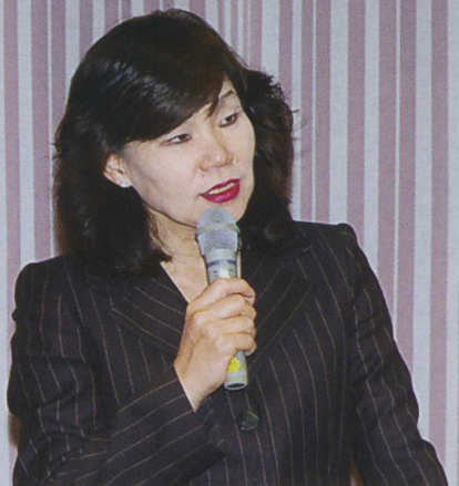
(株)ベネッセコーポレーション取締役副会長 ベルリッツインターナショナルインク代表取締役社長兼会長兼CEO 特定非営利活動法人J-Win 理事長