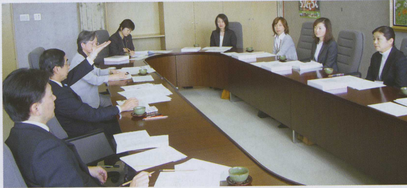
知事と女性活躍会議

ふくい女性ネットは、県内の企業、事業所、団体等で活躍中の女性が、相互交流と自己研鑽ならびに企業等における女性の活躍促進を目的として、講演会や交流事業、情報発信事業に取り組んでいます。 現在は、事業の趣旨に賛同いただいた企業等から派遣された20名の女性たちが、平成21年3月まで活動中です。