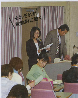
メンバーによる進行