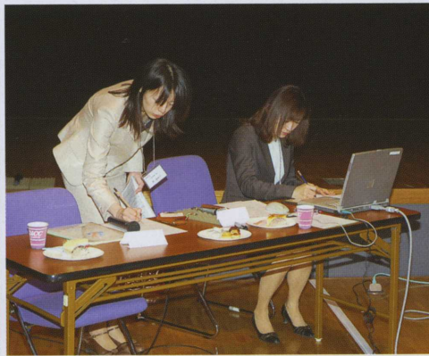
進行やシナリオも手作り