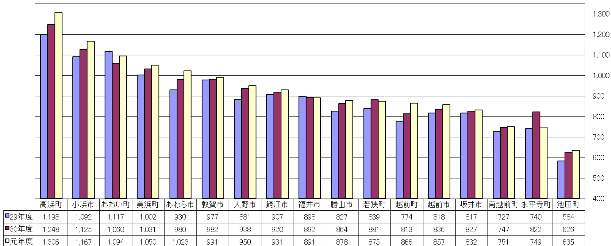
図-1 1人1日当たり排出量