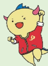
はぴりゅう 福井県マスコット キャラクター

家畜保健衛生所は、法律で都道府県にその設置が義務付けられている行政機関です。家畜衛生業務により、食の安全の確保や畜産業の振興を行っています。