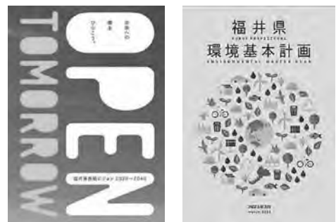
福井県長期ビジョン／福井県環境基本計画

例えば、県では、「エネルギー源の転換」として、ガソリン車から次世代自動車（EV・PHV・FCV）への転換支援や工場や業務ビルにおける太陽光発電および蓄電池の導入支援を行っています。また、「省エネ」の推進として、省エネ家電への買替促進や「うちエコ診断」によるCO 2 排出量の見える化など「省エネ県民運動の展開」、企業の省エネ設備の導入支援を行っています。