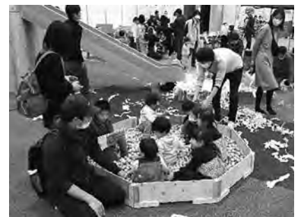
木望のゆうえんち