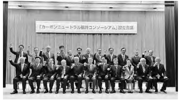
「カーボンニュートラル福井コンソーシアム」設立会議

素化推進事業枠」を設け、全庁を挙げて強力で脱炭素化を進めていくことを表明いたしました。これらの3つの組織を相互に連携させることにより、「オール福井」でカーボンニュートラルの実現に取り組んでいきます。