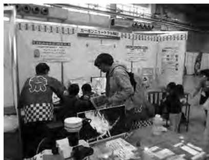
カーボンニュートラル緑日