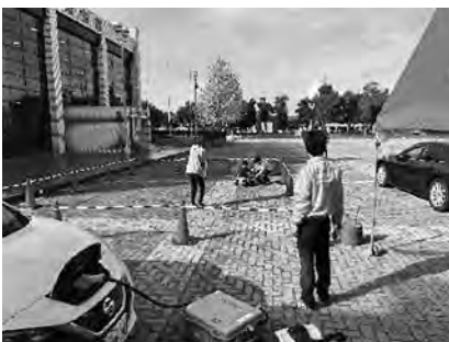
子ども向け電動バギー

SDGsやカーボンニュートラル、循環社会などをテーマに、合計33の体験・展示ブースを設けました。FCV（燃料電池自動車）やEV（電気自動車）の展示コーナーでは、新型車両や電動バギーの体験を実施したほか、EVからの充電システムを活用して子ども向け電動バギーに給電するなどEVの活用方法もPRしました。また、カーボンニュートラル緑日コーナーや木望のゆうえんちコーナーでは、子どもたちが楽しみながら環境保全について学習しました。