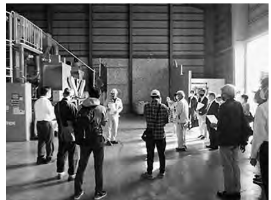
産業廃棄物処理施設の見学会

令和5年10月に「太陽光パネルのリサイクル」をテーマに産業廃棄物処理施設の見学会を開催し、県内から26名が参加しました。見学会では、リサイクル出来るパネルの種類やパネル表面にあるガラスのリサイクルなどについて活発な質疑応答が交わされました。