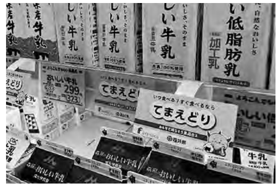
「てまえどり」ポップ

本県では、県民に広く「てまえどり」を普及させるため、県内スーパー等に県独自のポップやポスターを配布し、啓発しています。食品ロス削減のためには、一人ひとりの日々の心がけが大切です。