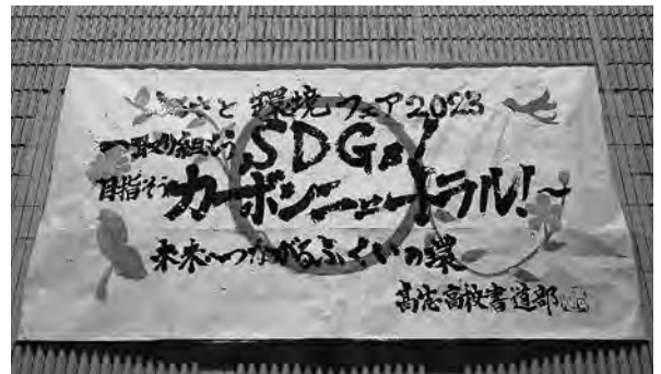
環境フェアテーマ（高志高校書道部揮毫）

そこで、今回の環境フェアでは、SDGsを糸口に、環境への負荷が少ない「持続可能な社会の構築」という視点から「環境」を捉え直し、県民自らの自主的な行動を促すことをテーマにし、様々な企画を実施しました。