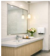
手洗い場のイメージ