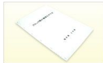
ブロック積み擁壁の手引き