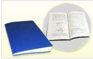
地盤調査マニュアル