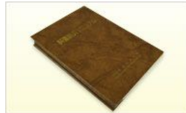
斜面防災マニュアル