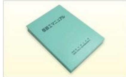
仮設工マニュアル