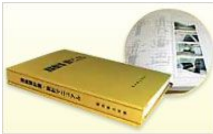
道路橋計画・設計マニュアル