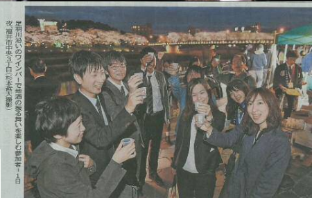
まつり開幕 足羽川並木ライトアップ

福井市の「おいしいふくい条例」施行を記念し、市商工振興課の職員から福井の地酒が振舞われました。桜の開花時期と重なり、満開の夜桜を愛でながら頂くお酒は格別のものでした。