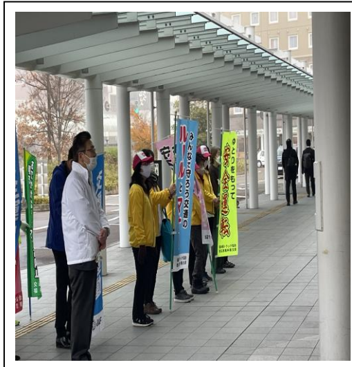
通行人に交通安全の呼びかけを行った