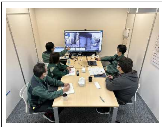
ドライブレコーダーによる教育指導・ 注意喚起