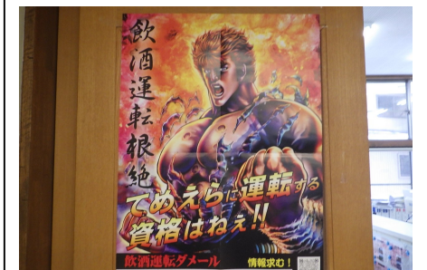
社内でのポスター掲示