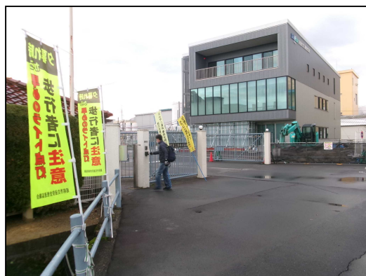
【写真①】 早朝指導の実施