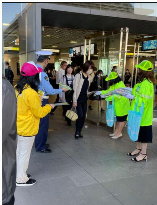
JR 福井駅西口にて啓発物を配布