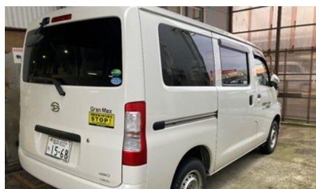
「STOP 横断歩道」キャンペーンに賛同