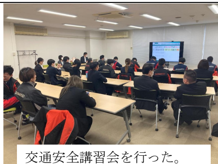
交通安全講習会を行った。