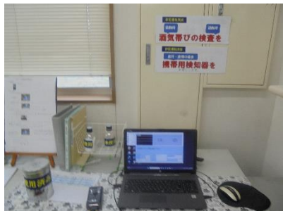
アルコールチェック