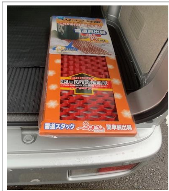
万が一に備えスタックラダーを車載