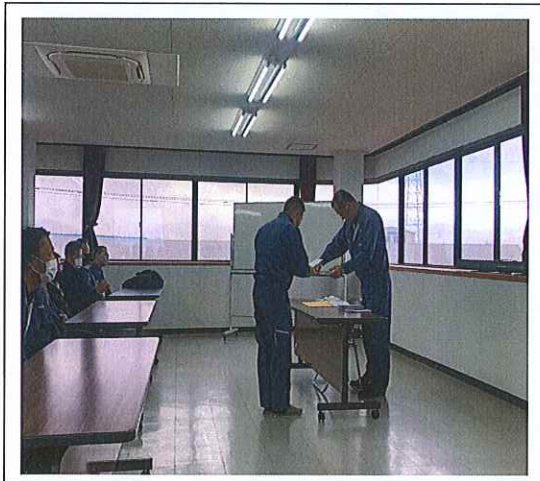
デジタコ成績優秀者を表彰した。