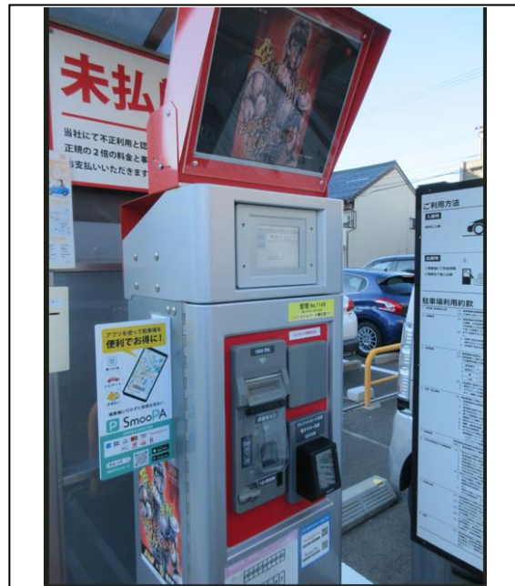
写真② 飲酒運転根絶の啓発活動