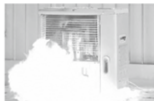
ガソリンの誤給油による発火 事故の再現映像