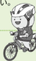
福井県マスコットキャラクター はびりゅう