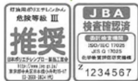
灯油用ポリタンクのラベル