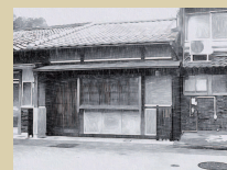
② つつど 着物レンタル