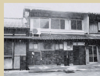
① みんなの研究室 サテライト研究所