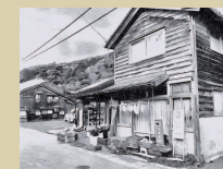
④ なんでもや まちのコンビニ