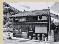
⑩ ところ 石窯パンの郷