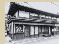
⑪ 吹安 雑貨屋 とレンタルスペース