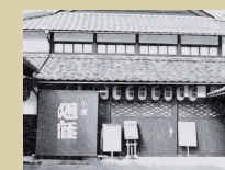
⑫ 旭座 明治期の現役の劇場

旧商店が多い鹿島地区の八幡神社の参道入り口。 区内を観光する際に一番最初に目に入り、 放生祭の際など人が集まる交差点に位置するこの物件には、 雑貨屋兼どなたでも出店できるレンタルスペースを。 いろいろな人が集まり、利用できる場所へとなるよう活用する。 珈琲を味わいながらまちを散策してみるのはいかが？