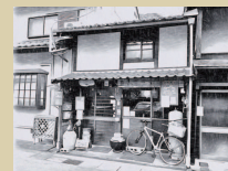
⑥ あるもんで食堂 アジア各国を旅する