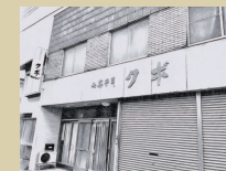
⑧ クギ いっぷくのお菓子は クギさんの。