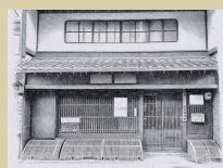
⑨ 保存資料館 地域歴史博物館