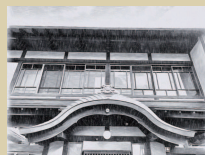
⑤ 大師湯 コモンスペース & シェアキッチン