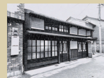
③ いっぷく 地酒を楽しむお食事処