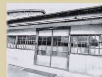
⑦ Garage 古材小物、山野草