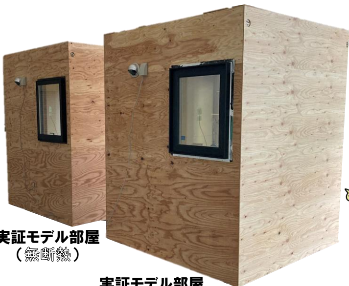
実証モデル部屋 (無断熱)