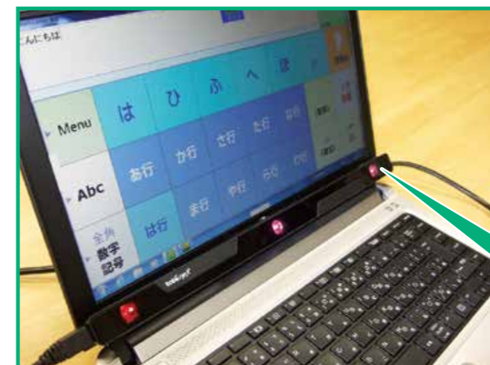
視線入力装置 tobii と、 ハーディーラダー（入力支援ソフト）搭載パソコン