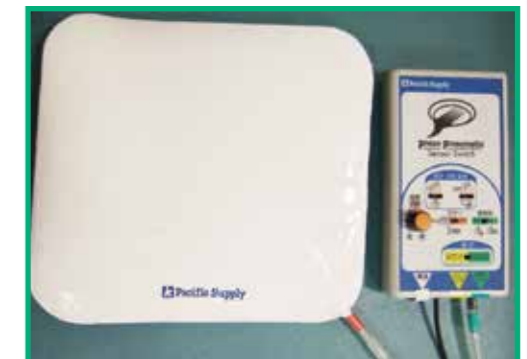
ピエゾニューマティックセンサースイッチ

■主な機器：伝の心、視線入力装置 tobii、 レッツチャット、トーキングエイド、 各種スイッチ、文字盤など