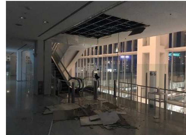
6階 天井板落下箇所