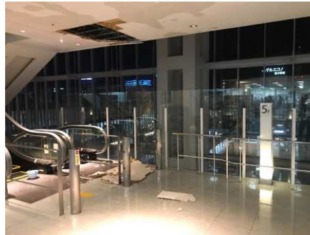
5階 天井板落下箇所