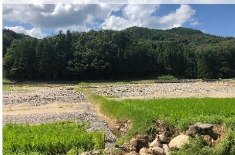
農地への土砂流入(勝山市北野津又)