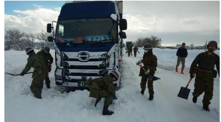
陸上自衛隊による除雪 (北陸自動車道下り)