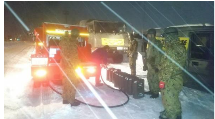
自衛隊による燃料配布 (北陸自動車道下り)