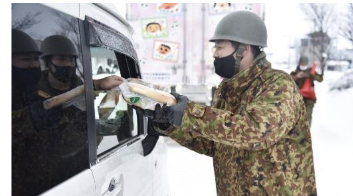
自衛隊による食料配布(国道8号)