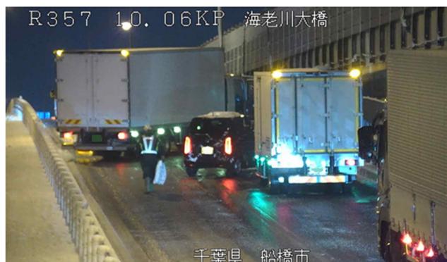
冬用タイヤやチェーン未装着車両による スリップ事故